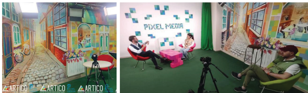
Imaginea 3: Pictură murală din incinta CRCT „Artico”, sala „Pixel Media Center”

Un decor inedit putem urmări în interiorul sălii din cadrul activităților „Pixel Media Center”. Aici s-a reușit să se creeze un spațiu cu iluzie optică în perspectivă aeriană. De asemenea, s-a utilizat o gamă caldă în tonuri deschise pentru a crea o atmosferă prielnică tinerilor jurnaliști (Imaginea 3).