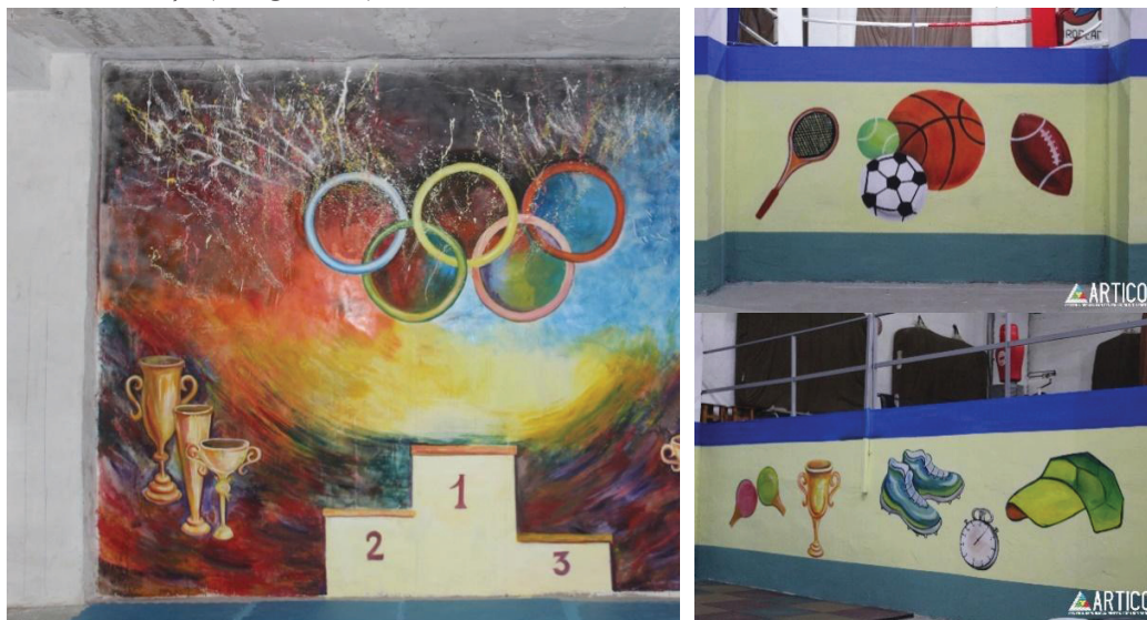
Imaginea 4: Pictură murală din incinta CRCT „Artico”, sala „Escalada”

Din domeniul sport, printr-o abordare creativă sunt prezentate picturile din sala „Escaladă”. Aceste imagini prezintă un mesaj informațional cu specificări de profilul cercurilor pe care le oferă Centrul Republican pentru Copii și Tineret „Artico”. Compozițiile dinamice completează atmosfera spiritului competitiv și a modului sănătos de viață (Imaginea 4).