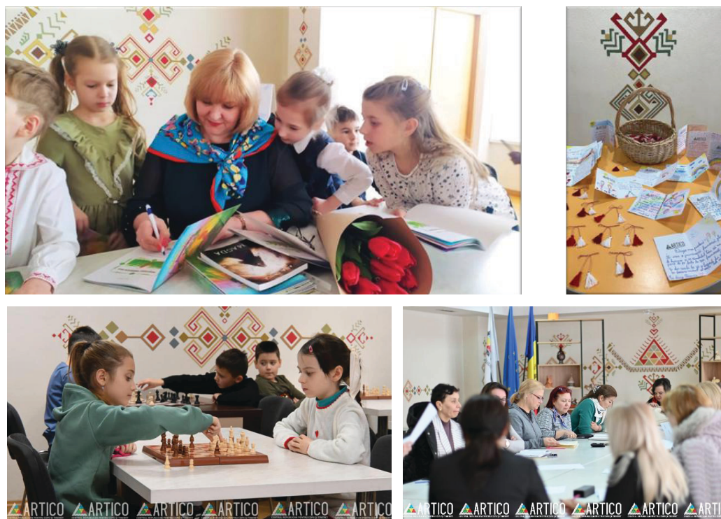
Imaginea 6: Pictură murală din incinta CRCT „Artico”, sala „Folk”, secvențe din activități variate

Acest decor îndeamnă de a păstra patrimoniul național material și spiritual al Republicii Moldova.