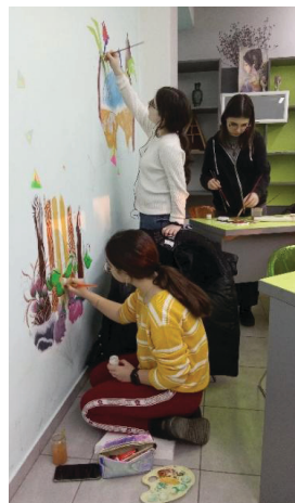
Imaginea 7: În proces de lucru pe o notă de inspirație a tinerelor artiste din cadrul cercului „Universul Design-ului”

Teoria culorilor de Kandinski, publicată în 1911, urmărea să explice modul în care pictorul își alege o anumită paletă: fie în funcție de efectul vizual, fie în funcție