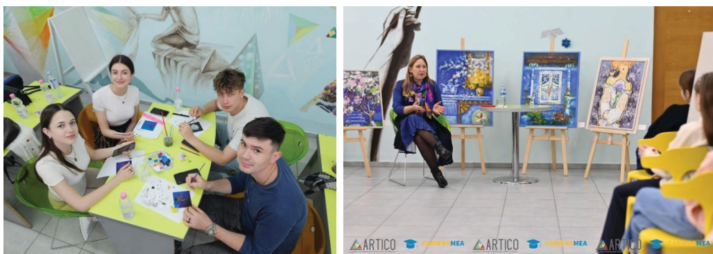
Imaginea 8: Diverse activități interactive organizate în atelier

Implicarea beneficiarilor în decorul atelierului de lucru le permite să-și dezvolte aptitudinile tehnice precum studiul desenului, al culorii și al compoziției, tehnici de transpunere, totodată își dezvoltă simțul critic, spirit de echipă, lărgirea orizontului conceptual, oferindu-i copilului de a experimenta tehnici din zona artelor media. Totodată, poate deservi un punct de reper pentru diverse tematici (Imaginea 8).