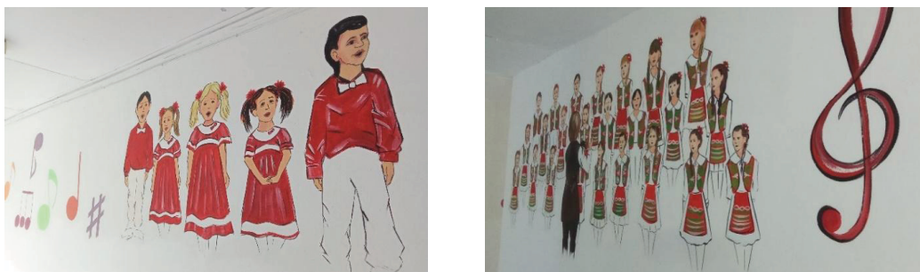
Imaginea 5: Pictură murală din incinta CRCT „Artico”, holul blocului C

Un ghid mural în lumea muzicii corale este realizat în holul blocului C al CRCT „Artico”, care redă cu o profunzime deosebită emoțiile unui copil în timpul prezentării scenice (Imaginea 5).