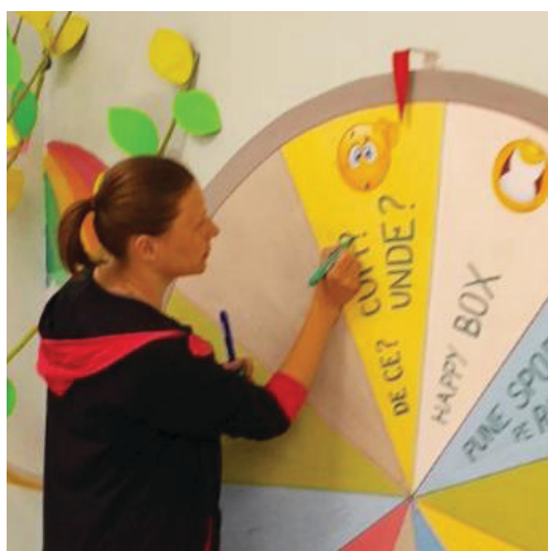
Imaginea 10: Material didactic „roata cu surprize”