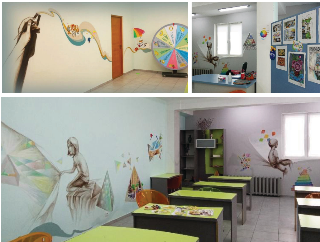
Imaginea 9: Prezentarea spațiului decorat al atelierului „Laboratorul creativ”

De asemenea, o metodă creativă de lucru cu copiii este utilizarea materialului didactic „roata cu surprize”. Acest decor poate fi utilizat printr-un joc interactiv la recapitularea temelor propuse din programul de învățământ. Procesul jocului este o sursă de plăcere, bucurii, un factor important de dezvoltare armonioasă a copilului (Imaginea 10). De aceea, în calitate de cadru didactic, țin cont de următoarele criterii: