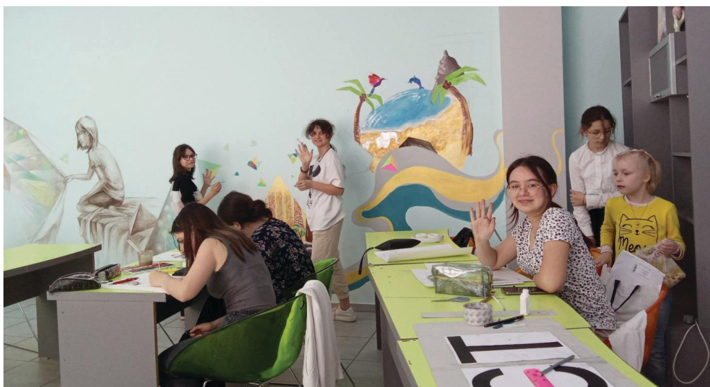
Imaginea 11: Secvență din activitatea de creativitate din cadrul cercului „Universul Design-ului” Folosiți arta ca să vă echilibrați viața emoțională!

Activitățile extrașcolare sunt benevole și poartă un caracter de formare, însă doar prin empatie și lucru în echipă transformă timpul liber într-o aventură de neuitat (Imaginea 11).