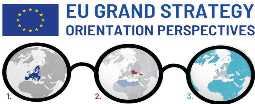
Figura 1. Lentilele orientării spre Marea Strategie a UE (Elaborat de autor.)

Pentru a aprofunda înțelegerea acestor abordări distincte și pentru a promova o viziune integrată a puterilor pe care UE le exercită, trebuie să ne referim la distincția făcută de Smith asupra elementelor cheie ale orientării marii strategii a UE. Chiar dacă rezonăm cu această idee, considerăm că o formulă diferită ar fi mai adecvată pentru a descrie fenomenul.