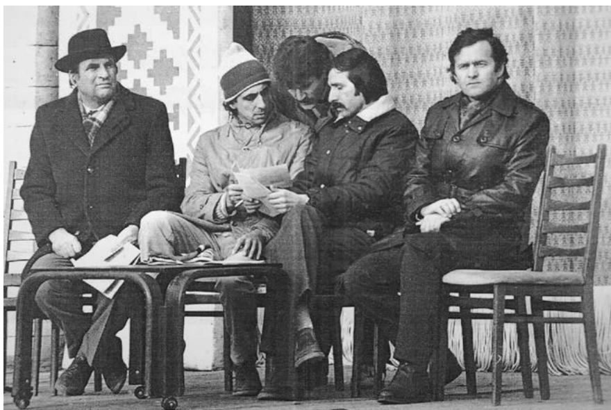
Unul din primele mitinguri ale mișcării democratice la Teatrul de Vară din iarna anilor 1988–1989.