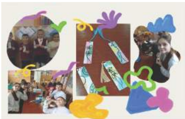
Imaginea 2. Activitatea în grup de decorare a obiectelor comunitare

Proiectele de grup, cum ar fi decorarea unor obiecte comunitare, îi învață pe participanți să lucreze împreună, să comunice eficient și să-și respecte contribuțiile reciproce, cultivând spiritul de echipă și solidaritatea.