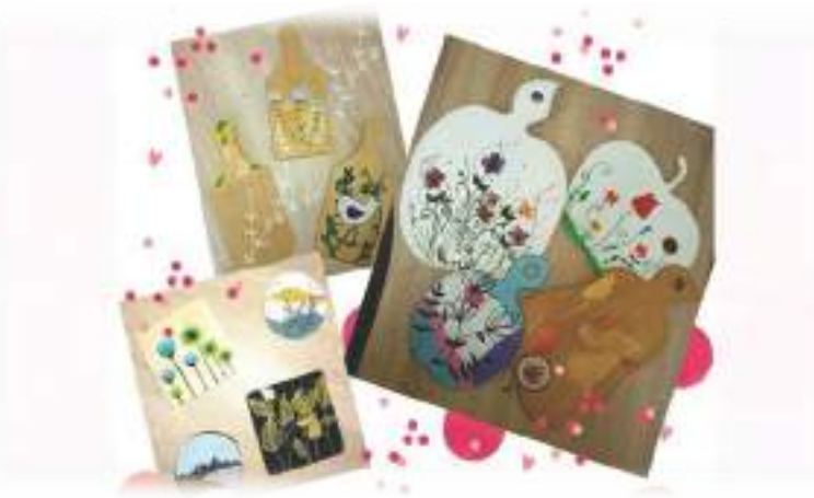
Imaginea 1. Produse ale elevilor cu tematica păcii, tehnica picturii pe lemn

Alături de beneficiarii Centrului de Creație a Copiilor Orhei, am explorat potențialul formativ al activității de pictură pe lemn ca metodă de promovare a înțelegerii reciproce și a armoniei interioare și sociale.