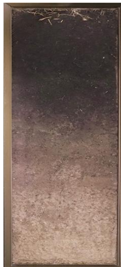
Figura 3. Monolit, cernoziom tipic luto - argilos înțelenit, 2024

În probele recoltate s-a determinat: higroscopicitatea; textura; alcătuirea structurală- cernere uscată și umedă pentru stratul arabil și subiacent; densitatea; conținutul humusului; pH-ul.