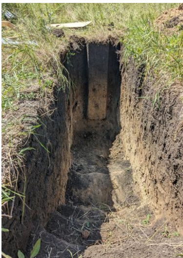
Figura 2. Cernoziom tipic luto - argilos înțelenit, 2024