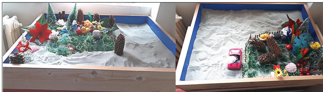
Figura 1: Tăvile construite în ședințele 1 și 2

se mută de pe o parte pe alta a spațiului de construit al tăvii cu nisip, iar o parte din tavă rămâne nelucrată. La cea de-a doua tavă subiectul ajunge să construiască o poveste pe baza scenei Sandtray Play. Simbolurile din povestea fetiței oferă o bogată paletă de interpretări care reflectă teme de apartenență, sprijin emoțional și adaptare la schimbări. Ele subliniază nu doar experiențele de zi cu zi ale subiectului, ci și nevoile sale fundamentale de conectare și acceptare, oferind o înțelegere profundă a cazului.