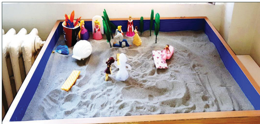
Figura 3: Tavă cu povestea în nisip, ședința 10

Povestea din ședința 10 redată așa cum subiectul a spus-o: Era un concurs. Cele șase prințese au mai rămas în joc. Erau 20 de prințese. Regina avea 3 premii: un săpun de 100 de ml, cel mai tare premiu – o statuie cu un joc de lumini, și ceva în scoică. Ele trebuiau să parcurgă 5 nivele, cele 6 prințese trebuiau să parcurgă 5 nivele ca să câștige. Primul nivel era să ia steagurile mergând prin lavă, dar erau și pietre acolo pe care ele le săreau. Întoarcerea era pe apă, să înoate cu steagul până la regină. Prima prințesă a sărit 3 pietre. S-a ars la picior și s-a dus la apă și i-a dus reginei. A doua prințesă și-a rupt rochia ca să sară pe pietre. A luat steagul și a mers până la regină. A treia prințesă s-a ars la mâini și la picioare și nu a mai vrut. A patra a sărit până la steagul ei, dar ea nu putea să înoate, s-a scufundat cu rochia și a murit. A cincea prințesă a zburat până la steagul ei și a reușit. A șasea prințesă a reușit să treacă, dar nu a putut să ia steagul pentru că era arsă și o dureau mâinile. Au rămas doar 3 prințese. A treia a ajuns la scoică și a deschis-o, a luat prințul și s-a căsătorit și au trăit fericiți până la adânci bătrânețe.