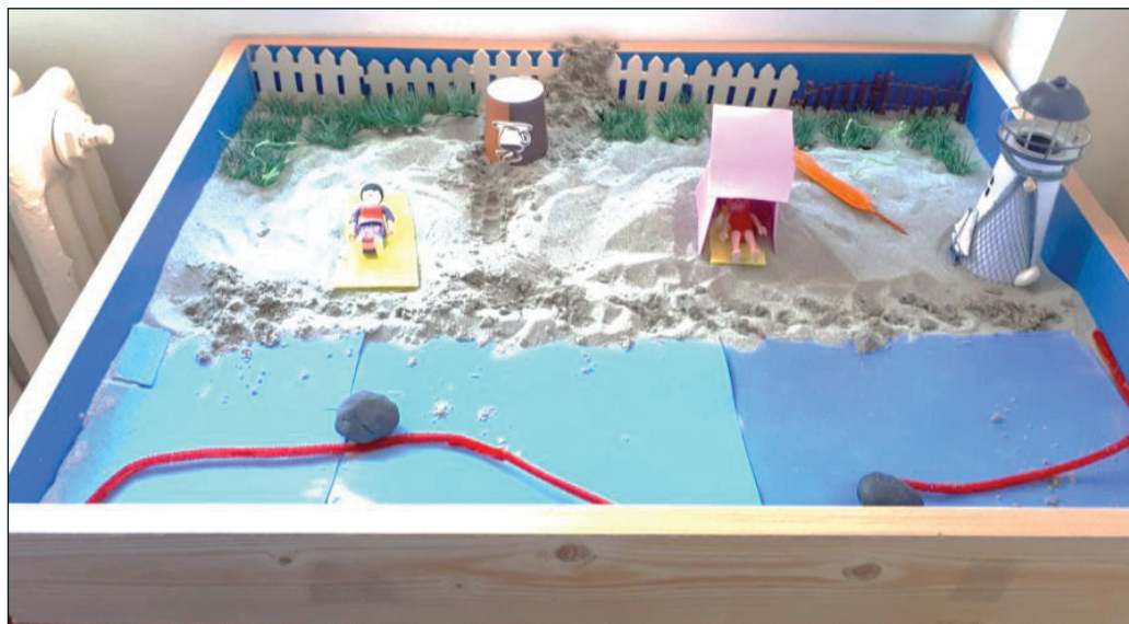
Figura 2: Tavă cu povestea în nisip, ședința 6

În următoarele sesiuni, activarea resurselor interioare se face accesând o amintire pe care o reface în scena de joc simbolic. De data aceasta întreaga suprafață a tăvii este folosită pentru a construi o scenă în nisip. Simbolistica miniaturilor și a întregii povești oferă perspective interesante asupra experiențelor, relațiilor și emoțiilor sale. Mediul în care se desfășoară scena reflectă relaxarea, este un spațiu diferențiat în două zone: apă și pământ. Conectarea în psihic cu straturi profunde, experimentarea sentimentelor de siguranță, relaxare, bucurie, sunt necesare pentru a reduce tensiunea în psihic. Teoria polivagală a lui Stephen Porges [2011] subliniază importanța sistemului nervos autonom în reglarea emoțiilor și comportamentului. Conectarea la resursele interioare ajută la activarea răspunsului de relaxare. Dr Barbara Turner [2004] a scris despre impactul jocului cu nisip asupra dezvoltării emoționale, subliniind importanța conectării cu straturile arhetipale în inconștient, de unde sunt activate resursele interne. Mai jos sunt: imaginea tăvii construite de subiectul studiului de caz la care facem referire și povestea asociată acestei scene de joc simbolic.