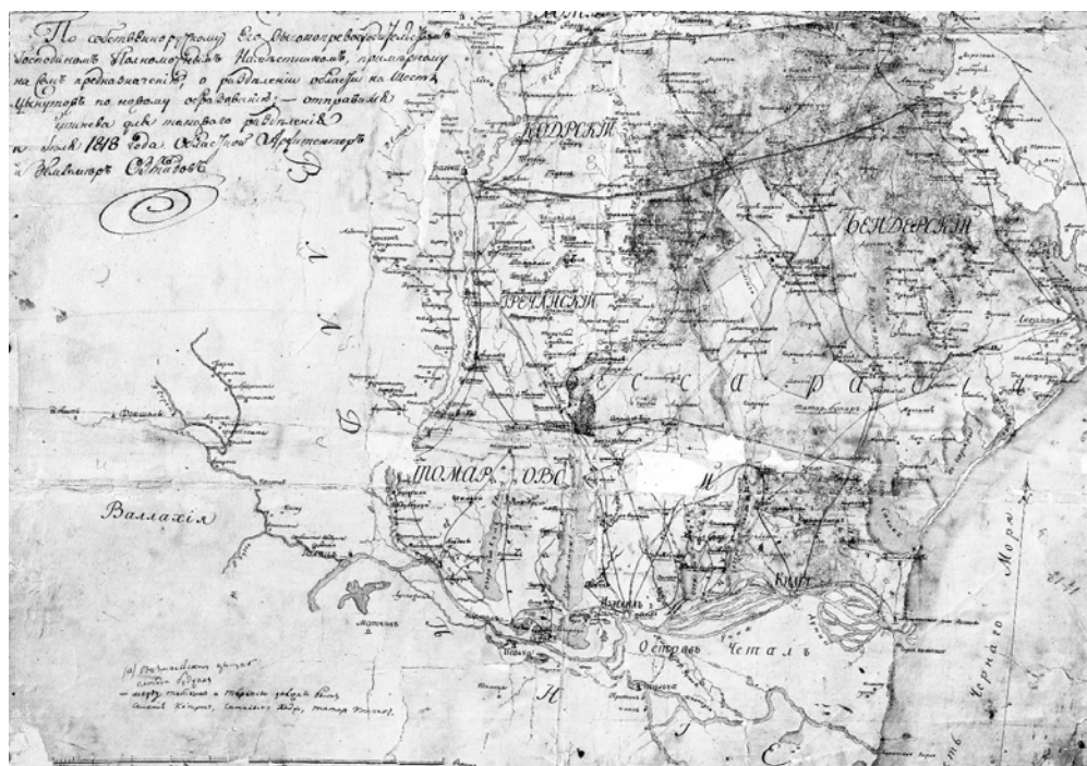
Harta Basarabiei la 1818 (Ținuturile Codru, Bender, Greceni și Tomarova – fragment) (ANA, F. 11, inv. 1, d. 1)

Aceeași sursă scrie că, în afară de ruptași, în Basarabia mai există o categorie de oameni care au un nume deosebit: rupta de vistierie și rupta de cămară . Aceștia sunt descendenți ai coloniștilor străini, în special bulgari și sârbi, care s-au așezat în aceste locuri încă în timpul domnilor pământeni, și străinii care pentru anumite servicii au primit dreptul să achite impozitele și să îndeplinească diferite prestații, separat de masa de bază a populației. Ei și-au căpătat denumirea de rupta de vistierie și rupta de cămară de la modalitatea de prestare a impozitelor: în haznaua comună a statului (vistierie) și în haznaua personală a domnului (cămară). După anexarea Basarabiei la Imperiul Rus, această particularitate a încetat să mai existe și ambele denumiri se păstrează pur formal, ca tradiție, fără anumite drepturi și privilegii deosebite.